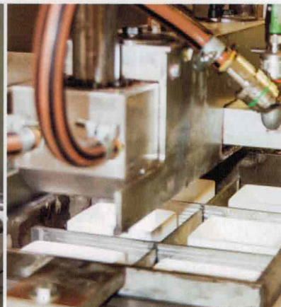
> Poste de formage

multiples au demeurant, une forme de calage est donc tout sauf anodine même s'il s'agit avant tout d'un faire valoir, au sens noble de l'expression. Sa réalisation est donc, elle aussi, tout sauf anonyme. Elle requiert, au contraire, un professionnalisme certain et ne saurait tolérer aucune approximation, de quelque nature que ce soit. Cette rigueur fait la force d'A3P Thermoformage qui pour se faire, peut compter sur les performances de son outil de production et le « métier » de ses collaborateurs. « Ces atouts précieux nous permettent, malgré notre taille relativement modeste, de compter parmi nos nombreux clients des noms à valeur de référence comme Chanel ou Valrhona par exemple mais aussi les cartonniers Autajon et Bes, le fromager Bel ou les parfums Lancôme, entre autres sans oublier l'enseigne de distribution Carrefour ou le groupe Sentosphère spécialisé, lui, dans les jeux de société. Le fait que nous soyons également à la fois sous-traitant et force de proposition est également beaucoup apprécié tout comme l'est également le fait que nous soyons en mesure d'adapter notre capacité de production et donc, de réaliser des séries de 1000 à plusieurs millions de pièces » résume Cédric Huon, directeur commercial.