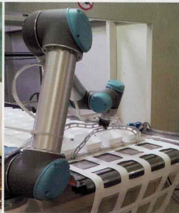
> Bras robotisé