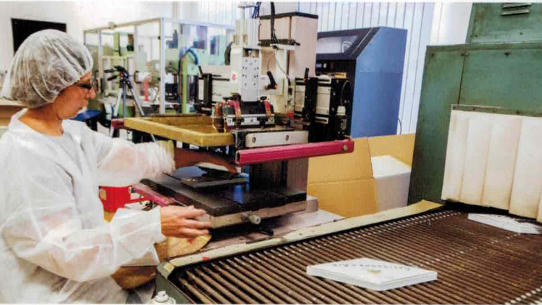
> Sérigraphie et passage au four

« Ces atouts précieux nous permettent, malgré notre taille relativement modeste, de compter parmi nos nombreux clients des noms à valeur de référence. »